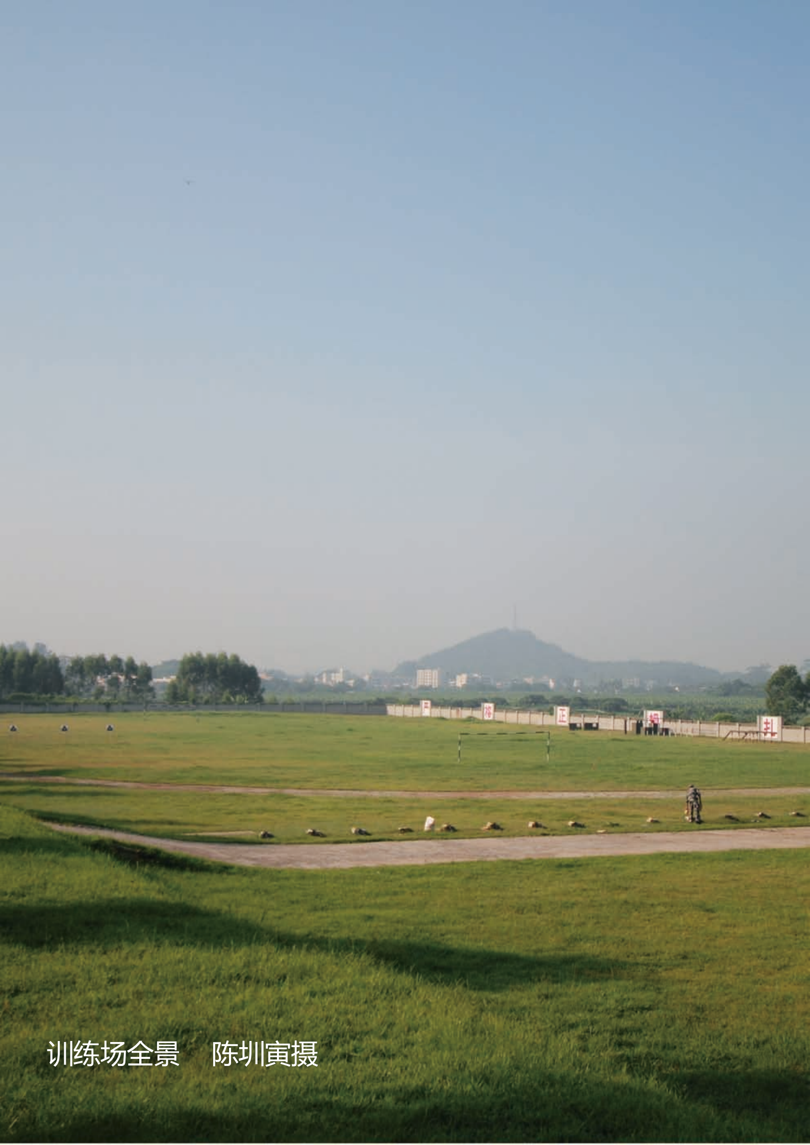
训练场全景