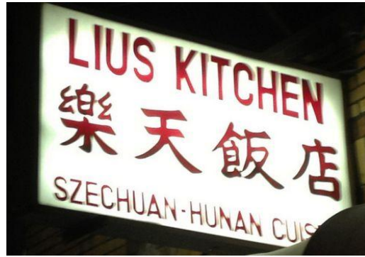
中英文意思相差很大的“乐天饭店” (Liu's Kitchen) Berkeleyside.com

一般来说，餐馆或者商家的标识都能很直观明确地显示出其所经营或从事的行业，以及所有者的名称和品牌的规模范围等。但在加州伯克利街头，这一现象却很少见，一些东亚国家餐馆店名的双语标识，更是让人摸不着头脑。为此，加州大学伯克利分校专门对这些现象进行了研究。